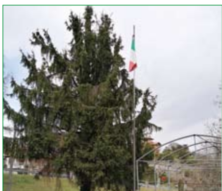
Gruppo di Bogno di Besozzo