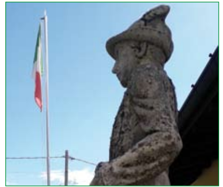
Gruppo di Cocquio Trevisago