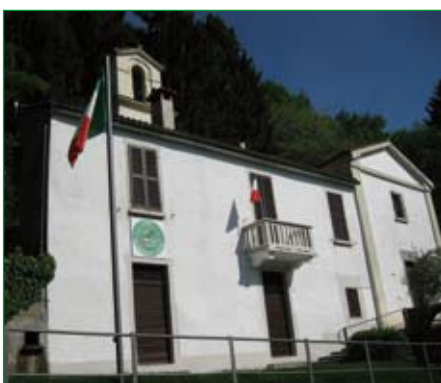
Gruppo di Brusimpiano