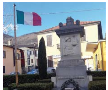
Gruppo di Saltrio - Monumento