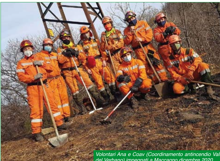
Volontari Ana e Coav (Coordinamento antincendio Valli del Verbano) impegnati a Maccagno dicembre 2020.