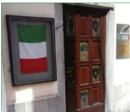
Gruppo di Cairate