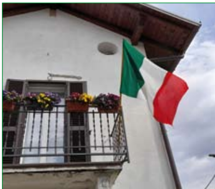
Gruppo di Angera

Come suggerito dal Presidente Favero il Tricolore è stato esposto il 17 marzo 2021, Giornata dell'Unità nazionale, della Costituzione, dell'Inno e della Bandiera, nelle sedi della Sezione di Varese e dei suoi Gruppi.