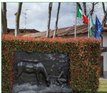
Gruppo di Origgio