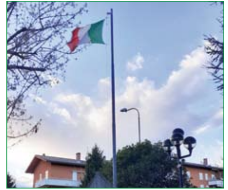
Gruppo di Solbiate Arno