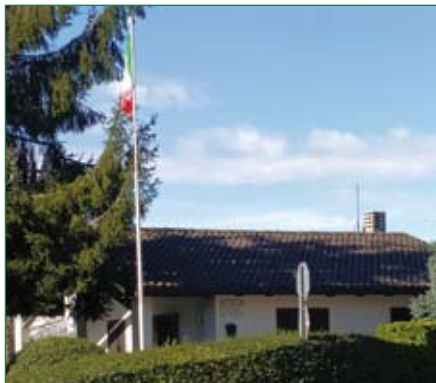
Gruppo di Tradate