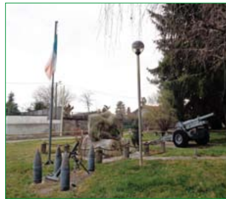
Gruppo di Arsago Seprio - monumento Alpini