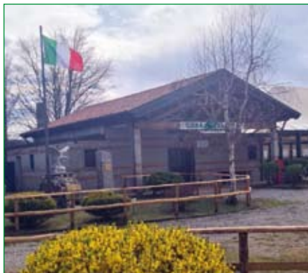
Gruppo di Arcisate