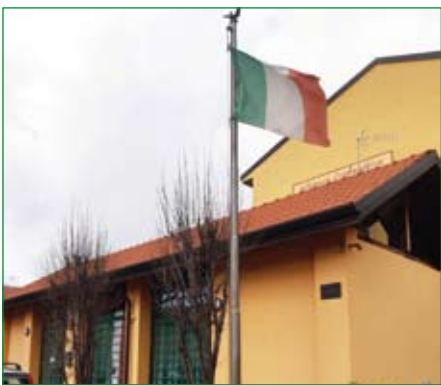
Gruppo di Ferno