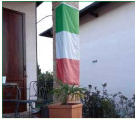
Gruppo di Gorla Minore