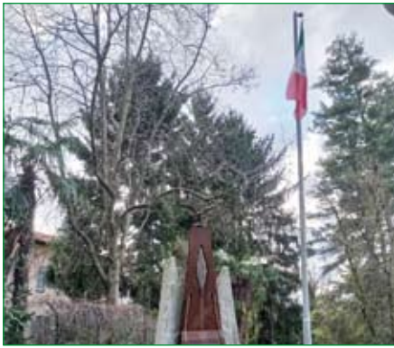
Gruppo di Golasecca - Cippo