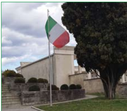
Gruppo di Morazzone