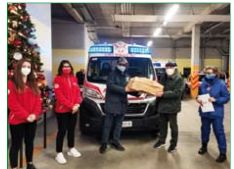
Comitato di Varese