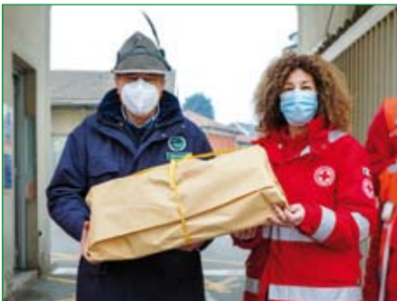
Comitato di Busto Arsizio