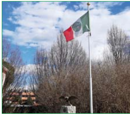
Gruppo di Cislago