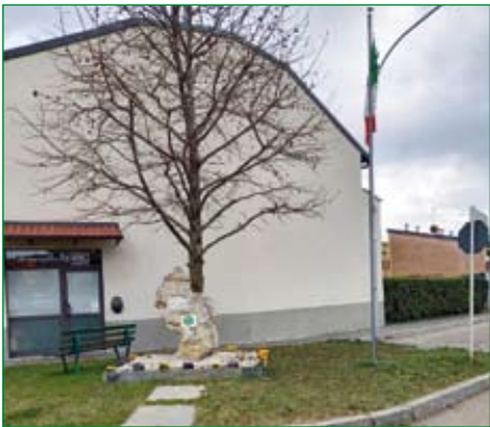
Gruppo di Caronno Varesino