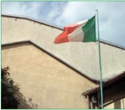
Gruppo di Saronno