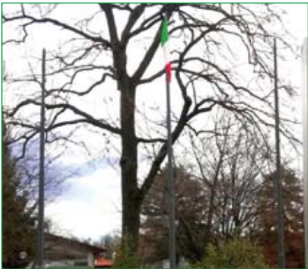
Gruppo di Castronno