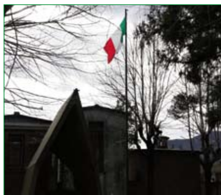
Gruppo di Porto Ceresio - Cappella degli Alpini