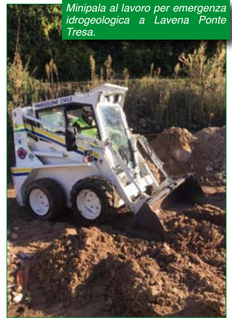
Minipala al lavoro per emergenza idrogeologica a Lavena Ponte Tresa.