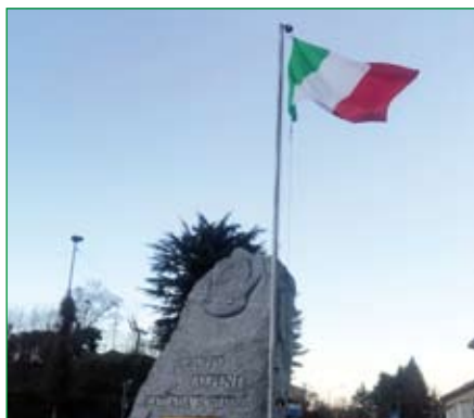
Gruppo di Gazzada Schianno - Cippo