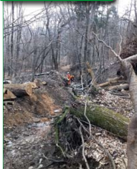
Gli effetti disastrosi degli eventi atmosferici nel territorio di Brinzio.

alla disponibilità dei vertici del Centro Polifunzionale Emergenze di Cesano Maderno sede del 2° raggruppamento ANA e di parte della colonna mobile di Regione Lombardia in capo agli Alpini.