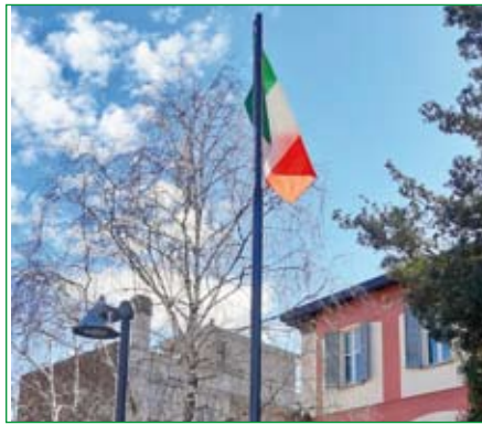
Gruppo di Cassano Magnago