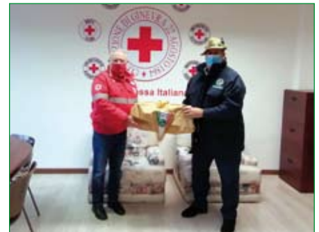
Comitato del Medio Verbano (Gavirate)