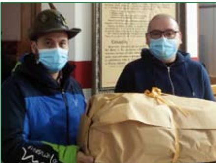
Comitato di Saronno