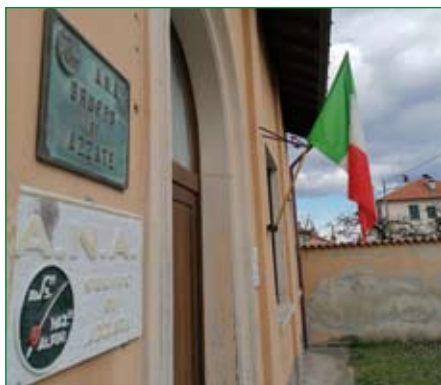
Gruppo di Azzate