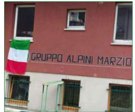
Gruppo di Marzio