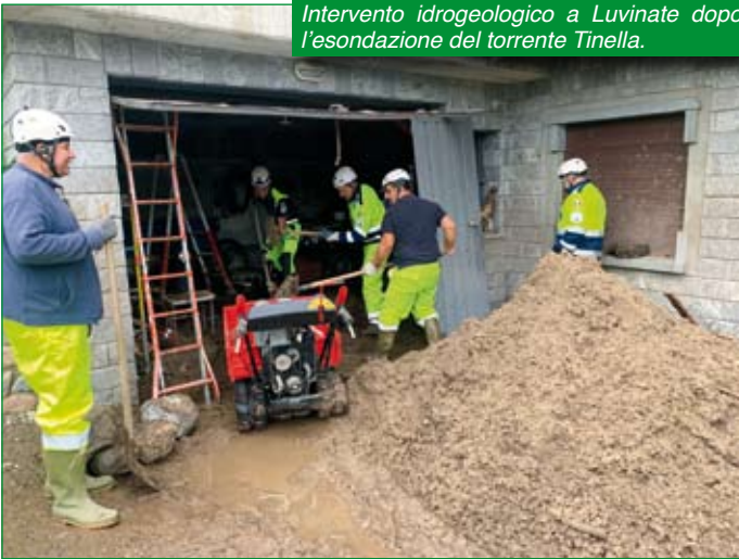
Intervento idrogeologico a Luvinate dopo l'esondazione del torrente Tinella.

e, in altri scenari, la necessità di ripulire dall'acqua zone abitate e scuole. Le attrezzature in dotazione si sono rivelate all'altezza ed hanno consentito un rapido intervento che ha consentito di alleviare la situazione in breve tempo per le popolazioni colpite. Gli interventi, seppur spesso si siano dovuti compiere in modo rapido ed imprevisto, sono poi durati diversi giorni poiché le aree colpite erano di difficile