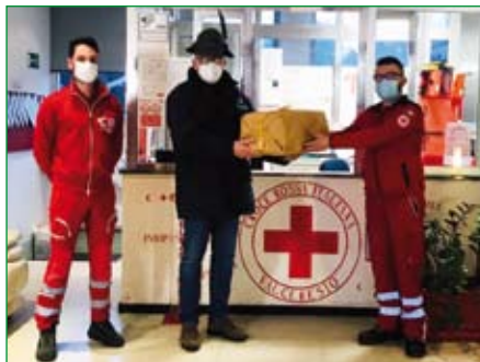
Comitato di Valceresio