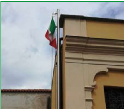
Gruppo di Solbiate Olona