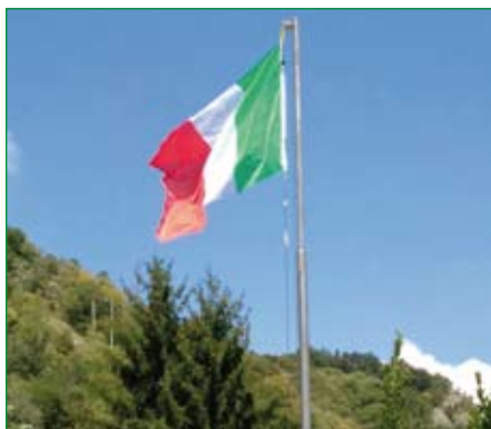
Gruppo di Caravate - Sasso del Poiano