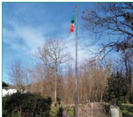
Gruppo di Oggiona S. Stefano