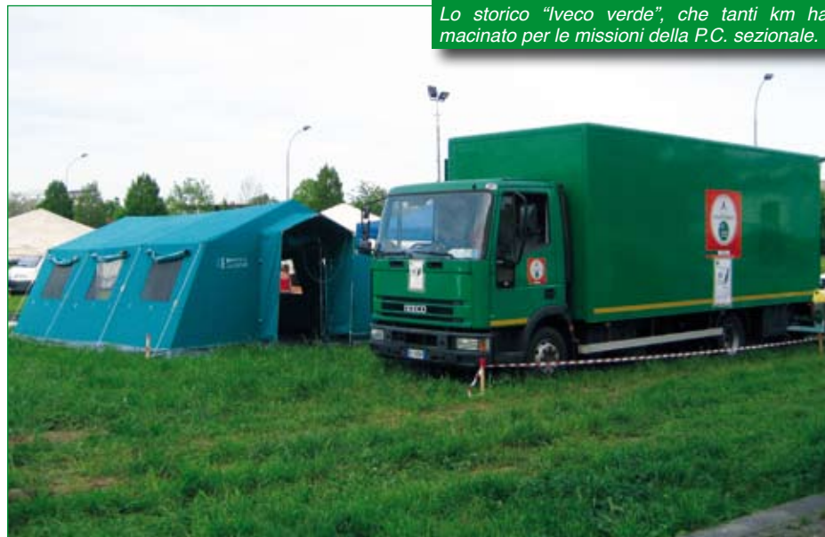
Lo storico "Iveco verde", che tanti km ha macinato per le missioni della P.C. sezionale.