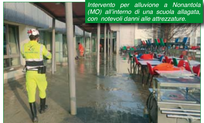
Intervento per alluvione a Nonantola (MO) all'interno di una scuola allagata, con notevoli danni alle attrezzature.