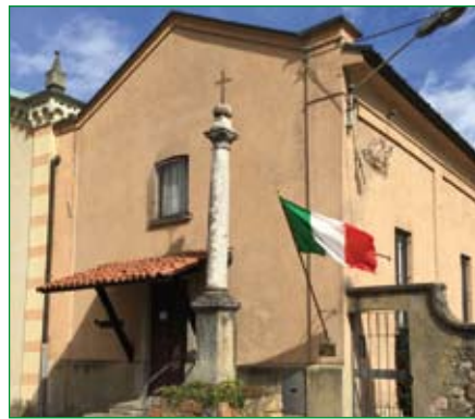
Gruppo di Vedano Olona