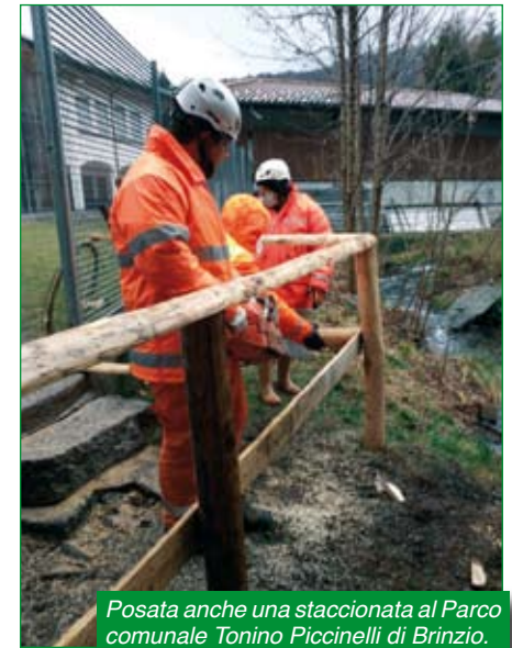
Posata anche una staccionata al Parco comunale Tonino Piccinelli di Brinzio.