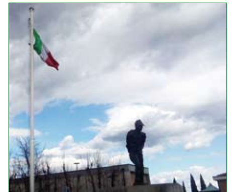
Gruppo di Uboldo