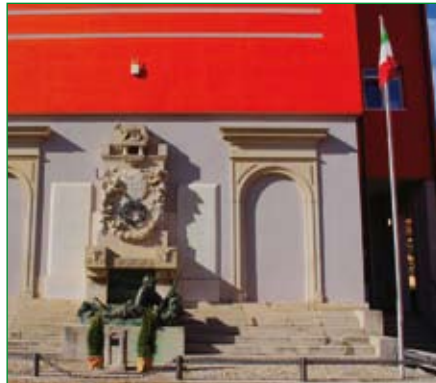
Gruppo di Viggiù Clivio - Monumento

Carissimi, il 17 marzo 1861 si compiva l'atto fondante della nascita della nostra nazione: veniva ufficialmente costituito il Regno d'Italia. In questa data, nel 2012, è stato stabilito di festeggiare la giornata dell'Unità nazionale, della Costituzione, dell'Inno e della Bandiera. Proprio in questo periodo così difficile per la nostra Patria dobbiamo dimostrare coesione e unità d'intenti, per cui, anche come doveroso omaggio a quanti ci hanno lasciato, vuoi compiendo generosamente il loro dovere fino all'estremo sacrificio, vuoi perché portati via da questa maledetta pandemia, esponiamo il Tricolore sui pennoni e alle finestre delle nostre sedi nel rispetto assoluto delle disposizioni vigenti. Sarà un momento importante, in cui diremo che "ci siamo" e siamo pronti ancor una volta e ancora di più ad impegnarci per le nostre comunità, i nostri paesi, le nostre città, le nostre valli. E che questo sia l'auspicio di poterci presto ritrovare, più uniti che mai, più forti prima. Nell'esortarVi affinché disponiate che l'adesione dei Gruppi sia la più completa possibile, Vi saluto con un Evviva gli Alpini, Evviva la nostra Bandiera, Evviva l'Italia.