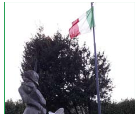
Gruppo di Olgiate Olona