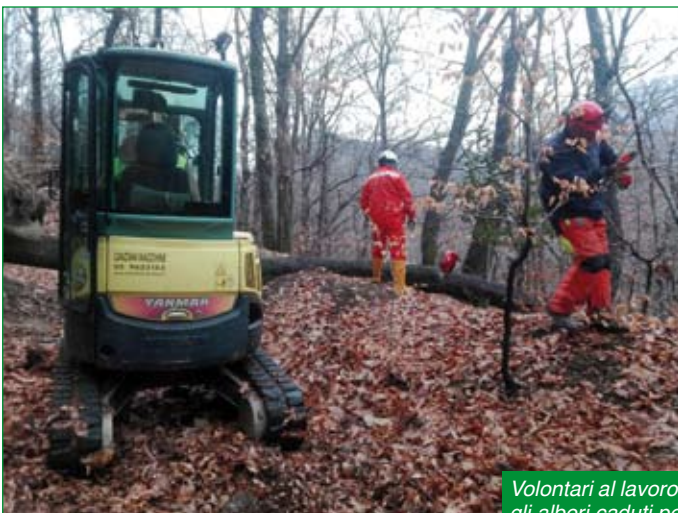
Volontari al lavoro a Brinzio per rimuovere gli alberi caduti per gli eventi atmosferici.