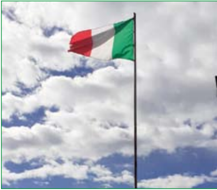
Gruppo di Cardana di Besozzo