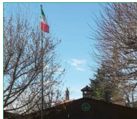
Gruppo di Caravate - Sede