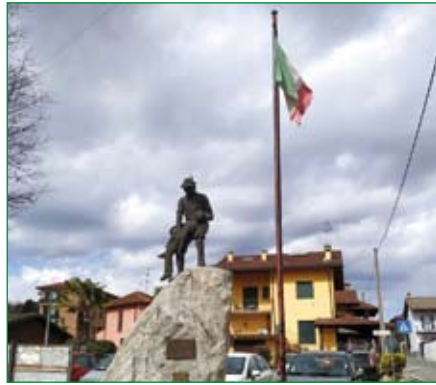
Gruppo di Sesto Calende - Monumento