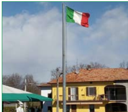
Gruppo di Leggiano Sangiano