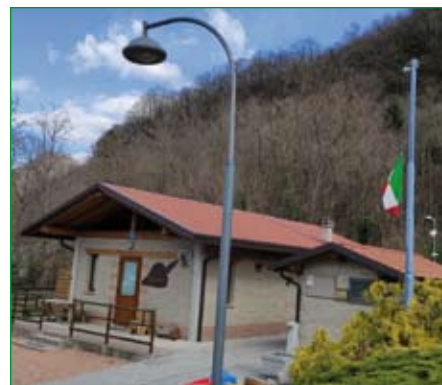
Gruppo di Besano