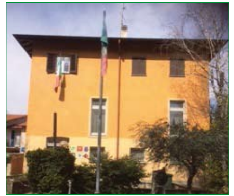
Gruppo di Castellanza