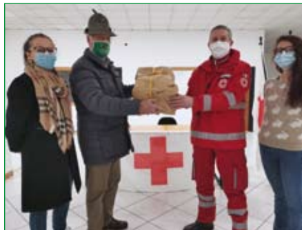
Comitato di Gallarate