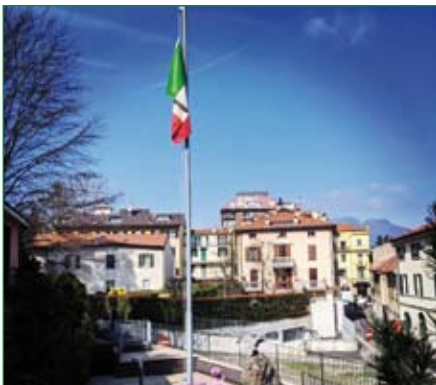
Sede della Sezione e del Gruppo di Varese