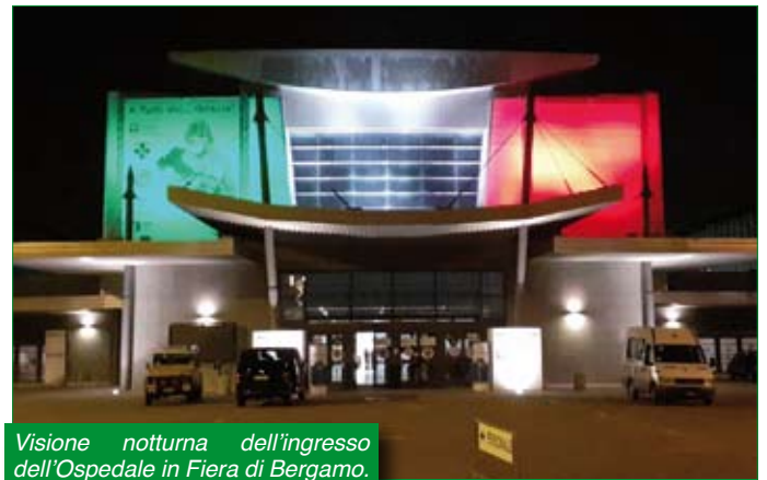
Visione notturna dell'ingresso dell'Ospedale in Fiera di Bergamo.

Quanto sopra si aggiunge alle nostre attività di antincendio boschivo. Proprio nei giorni precedenti la messa in stampa del nostro giornalino, Regione Lombardia ha diramato lo stato di massima allerta per incendi boschivi.