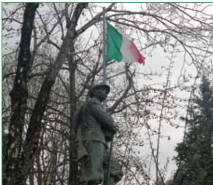
Gruppo di Laveno Mombello