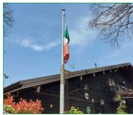
Gruppo di Busto Arsizio