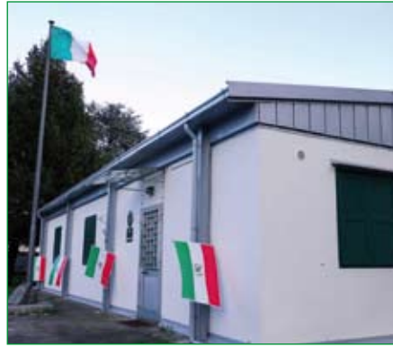
Gruppo di Cardano al Campo