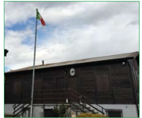
Gruppo di Ispra