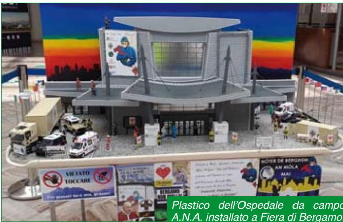
Plastico dell'Ospedale da campo A.N.A. installato a Fiera di Bergamo.

La nostra squadra sezionale alto rischio è composta attualmente da 5 volontari, ai 3 formati qualche anno fa se ne sono aggiunti due che hanno completato il percorso formativo a dicembre dello scorso anno.