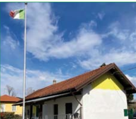
Gruppo di Vergiate