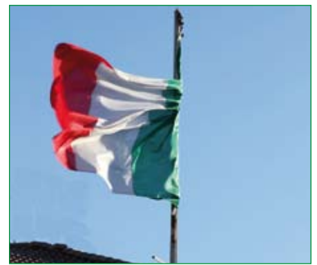
Gruppo di Gemonio