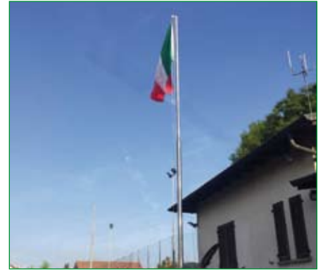
Gruppo di Caronno Pertusella Bariola