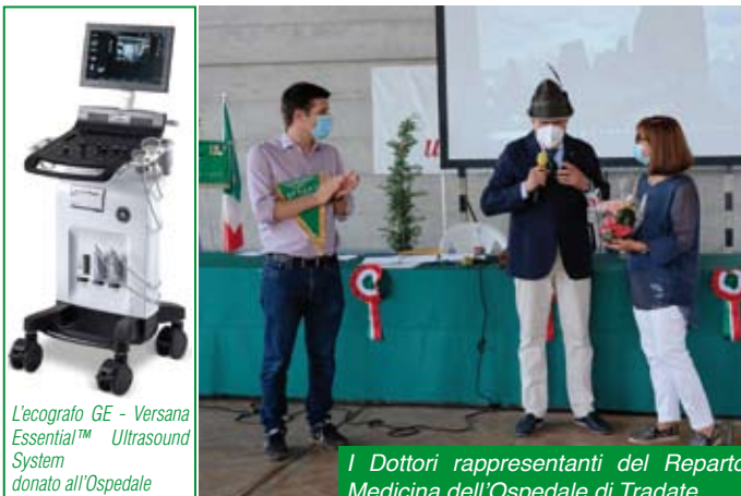
L'ecografo GE - Versana Essential™ Ultrasound System donato all'Ospedale