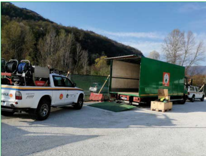
I mezzi utilizzati per il trasporto di uomini e attrezzature della Protezione Civile della Sezione di Varese a Rancio Valcuvia.

A pieno regime sono state somministrate circa 1.400 dosi giornaliere.