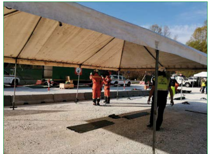
Fase di montaggio delle strutture all'Hub Vaccini di Rancio Valcuvia.