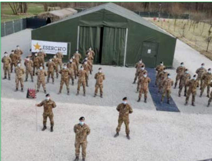
Il personale dell'Esercito Italiano in servizio al Centro Vaccini di Rancio Valcuvia.