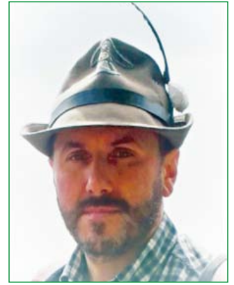
La Grotteria Guido Consigliere Deleg. Zona 5 - Cerimoniere