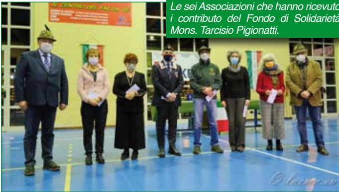
Le sei Associazioni che hanno ricevuto il contributo del Fondo di Solidarietà Mons. Tarcisio Pigionatti.