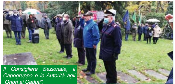
Il Consigliere Sezionale, il Capogruppo e le Autorità agli "Onori ai Caduti".

Un inizio Novembre speciale quello del 2021, anno che sarà ricordato non solo per le persistenti difficoltà in campo sanitario ma anche per particolari ricorrenze in ambito nazionale e in ambito locale.