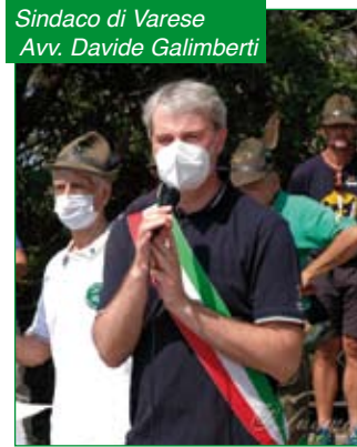
Sindaco di Varese Avv. Davide Galimberti