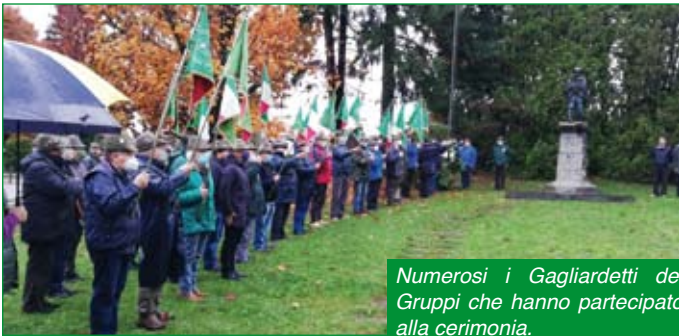
Numerosi i Gagliardetti dei Gruppi che hanno partecipato alla cerimonia.