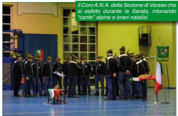
Il Coro A.N.A. della Sezione di Varese che si esibito durante la Serata, intonando "cante" alpine e brani natalizi.