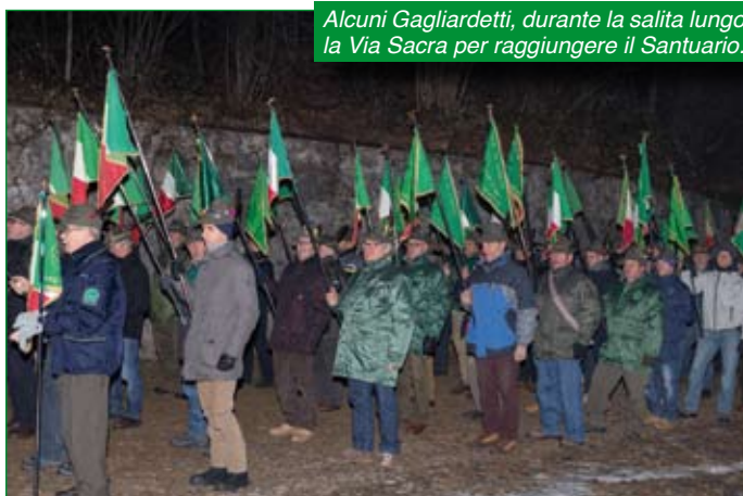
Alcuni Gagliardetti, durante la salita lungo la Via Sacra per raggiungere il Santuario.