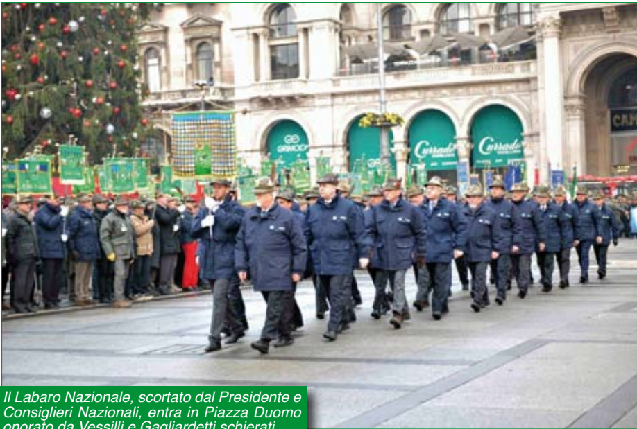
Il Labaro Nazionale, scortato dal Presidente e Consiglieri Nazionali, entra in Piazza Duomo onorato da Vessilli e Gagliardetti schierati.