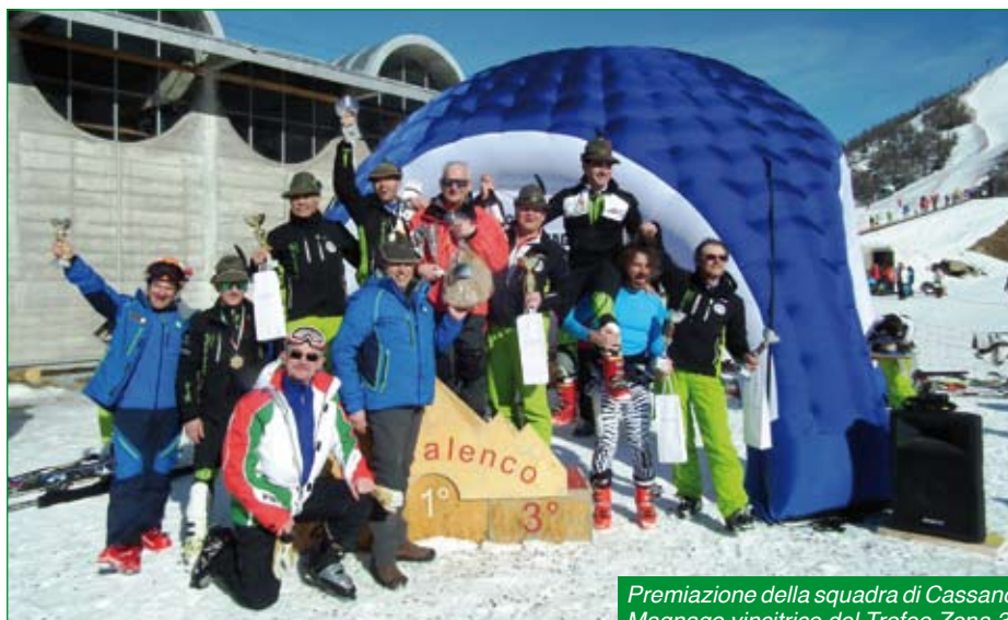
Premiazione della squadra di Cassano Magnago vincitrice del Trofeo Zona 3.