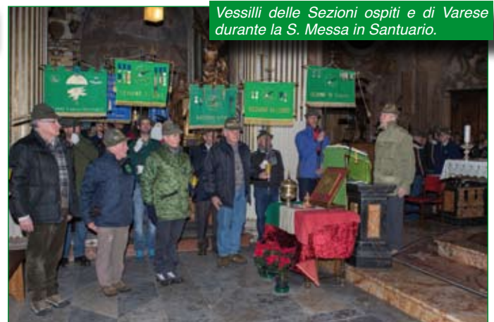
Vessilli delle Sezioni ospiti e di Varese durante la S. Messa in Santuario.