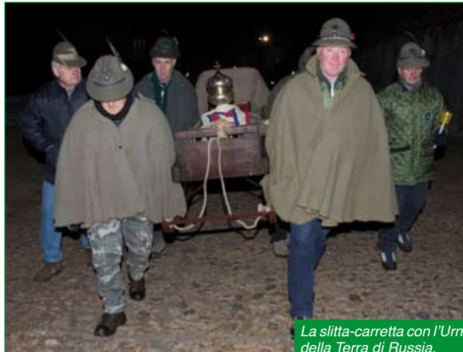
La slitta-carretta con l'Urna della Terra di Russia.

Recuperiamo in futuro l'unicità e la solennità della memoria di Nikolajewka con iniziative e gesti da veri Alpini e che gli stessi possano ricordare nella notte dei tempi finché l'ultimo di noi non sarà andato avanti all'incontro con questi eroi.