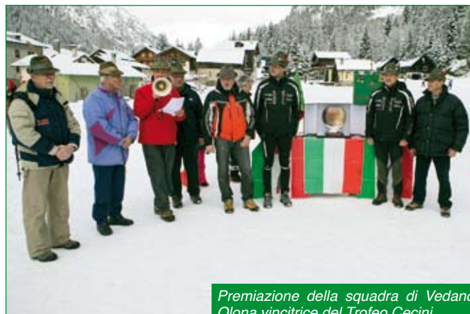
Premiazione della squadra di Vedano Olona vincitrice del Trofeo Cecini.