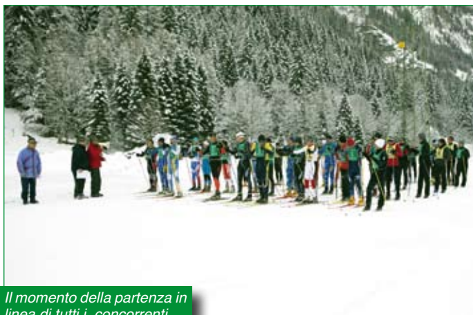
Il momento della partenza in linea di tutti i concorrenti.