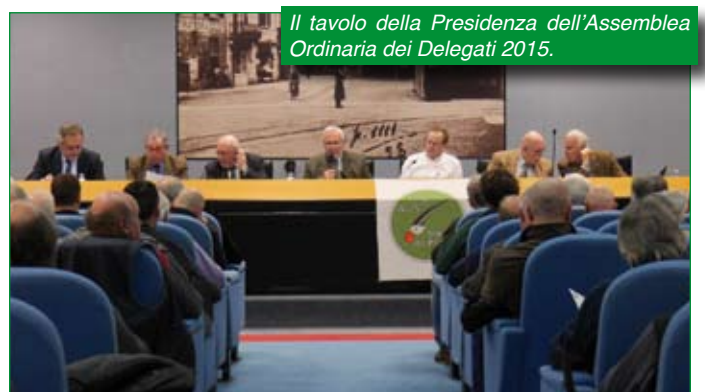
Il tavolo della Presidenza dell'Assemblea Ordinaria dei Delegati 2015.