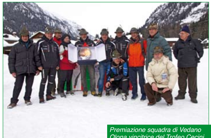
Premiazione squadra di Vedano Olona vincitrice del Trofeo Cecini.