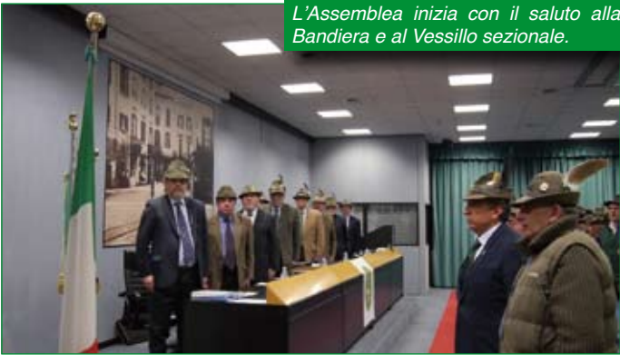
L'Assemblea inizia con il saluto alla Bandiera e al Vessillo sezionale.

L'assemblea Ordinaria dei Delegati della Sezione A.N.A. di Varese è convocata sabato 7 marzo presso la sala riunioni dell'Associazione Commercianti di Varese.