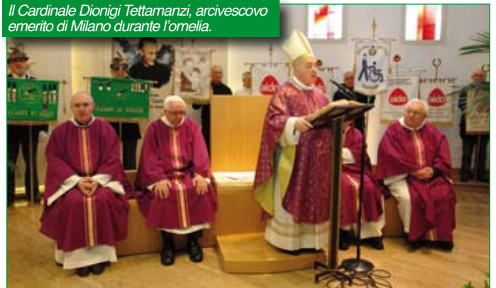
Il Cardinale Dionigi Tettamanzi, arcivescovo emerito di Milano durante l'omelia.