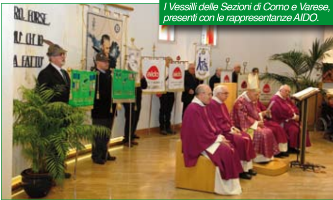
I Vessilli delle Sezioni di Como e Varese, presenti con le rappresentanze AIDO.

pomeriggio del 28 febbraio del 1956 in una stanza della Clinica Columbus di Milano, dove era stato ricoverato per una grave forma di tumore. Il Santuario del beato don Gnocchi, solennemente consacrato dallo stesso cardinale Dionigi Tettamanzi, nel primo anniversario della beatificazione del "papà dei mutilati" (24 ottobre 2010) era gremito di ex