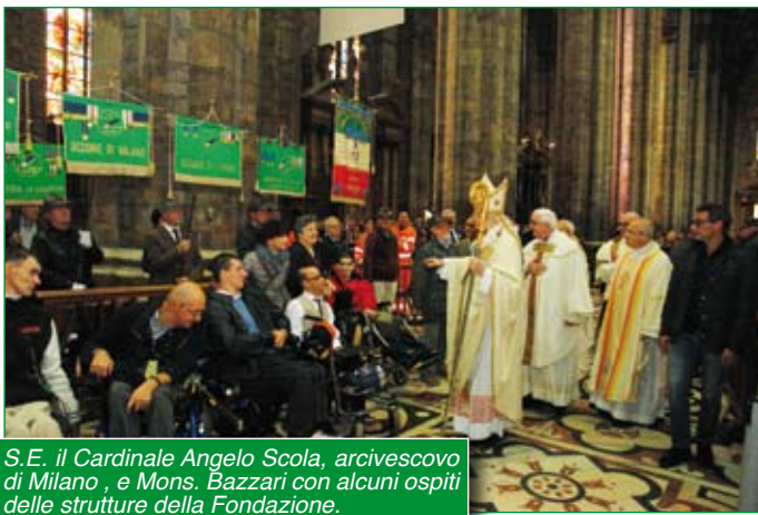
S.E. il Cardinale Angelo Scola, arcivescovo di Milano, e Mons. Bazzari con alcuni ospiti delle strutture della Fondazione.