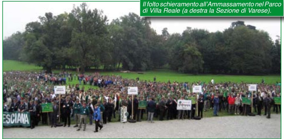
Il folto schieramento all'Ammassamento nel Parco di Villa Reale (a destra la Sezione di Varese).

schieramenti per Sezione, abbiamo potuto ammirare quel gioiello che è la Villa Reale e il suo parco, ottimamente tenuto e famoso nel mondo, oltre che per la sua bellezza, anche perché ospita l'Autodromo dove, tra l'altro, si disputa il Gran Premio d'Italia di automobilismo.