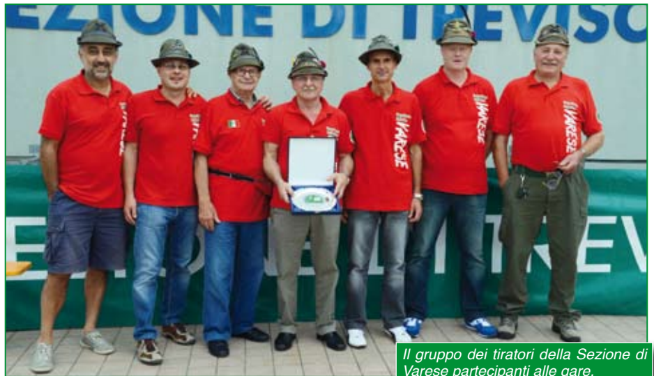
Il gruppo dei tiratori della Sezione di Varese partecipanti alle gare.

di pistole per il rancio a cui sono seguite le premiazioni. Un grazie ai nostri atleti con l'augurio che l'anno prossimo partecipino anche coloro che quest'anno sono stati assenti per malattia o per motivi personali.