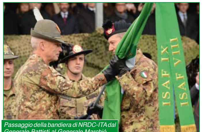
Passaggio della bandiera di NRDC-ITA dal Generale Battisti al Generale Marchiò