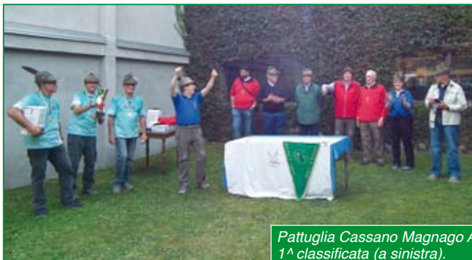
Pattuglia Cassano Magnago A 1 a classificata (a sinistra).

Domenica 5 ottobre scorso, di buon mattino, presso il poligono di tiro di Varese, gli Alpini partecipanti alla 28 a edizione della gara di Tiro e marcia di regolarità, organizzata dal gruppo di Varese in collaborazione con la Campo dei Fiori, si preparano alla competizione. 19 pattuglie per cinquantasette Alpini di 10 Gruppi diversi. Sulle piazzole di tiro si avvicendano 8 pattuglie per turno; i tre componenti la pattuglia sono assistiti dal personale del Poligono, dispongono di 20 minuti in totale per sparare ognuno 7 colpi con lo scarto dei due peggiori; al termine vengono avviati con diversi pulmini alla partenza della marcia.