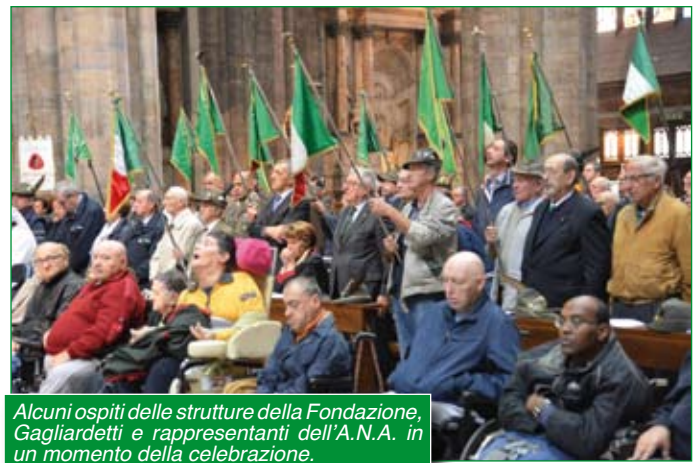
Alcuni ospiti delle strutture della Fondazione, Gagliardetti e rappresentanti dell'A.N.A. in un momento della celebrazione.