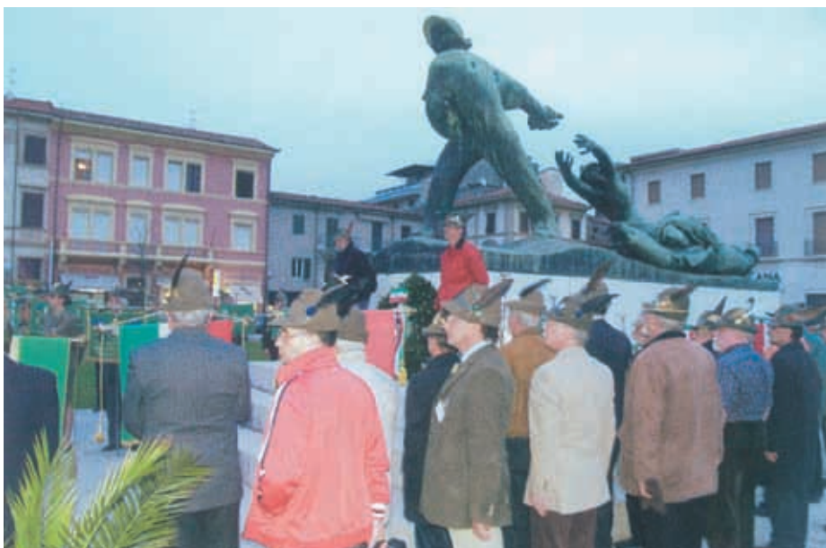
Onori ai Caduti di Viareggio